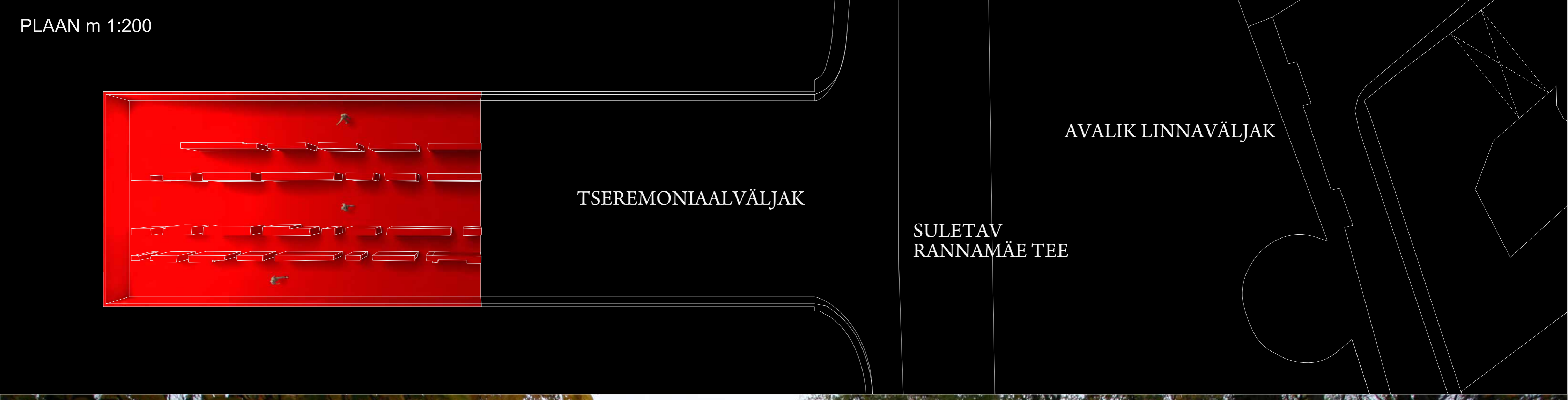
PLAAN m 1:200

Kommunismiohvrite memoriaal Skoone bastioni endises tsiviilkaitsevarjendis töötab eelkõige isikliku ruumilisele kogemuse kaudu. Endisest varjendist on eemaldatud esisein ning hulganisti risti paiknevaid seinu, tekib sügavale bastionisse lõikuv madal ja rusuv ruum. Erkpunase ja niiske varjendi lõpuossa on paigutatud väga tugevad valgustid, mis sisenejale näkku suunatuna süvendavad veelgi ebamugavat ruumilist kogemust. Seega viitab monument väga isiklikele kannatustele, meetoditele kuidas kommunistlik režiim surus maha inimeste isiksusi ja tappis eneseväärikust. Lisaks viitab olemasoleva nõukogudeaegse varjendi kasutamine kommunistliku režiimi poolt põhjustatud absurdelt mastaapsetele ruumilistele muudatustele ja seda nii üldises kui isiklikus plaanis. Asukoha valikul on lisaks dramaatilisele ruumilisele olukorrale lähtunud sellest, et töös olevate planeeringute järgi on plaan kas Rannamäe tee sulgeda ja muuta jalakäijate alaks või siis vähendada selle liikluskoormust ühesuunaliseks teeks muutmisega. Mõlemal juhul on soodustatud Skoone bastioni taas sidumine linnaga ja seda ümbritseva rekreatsioonialaga. Memoriaal oleks üheks sammuks ala taaskasutuselevõtuks.