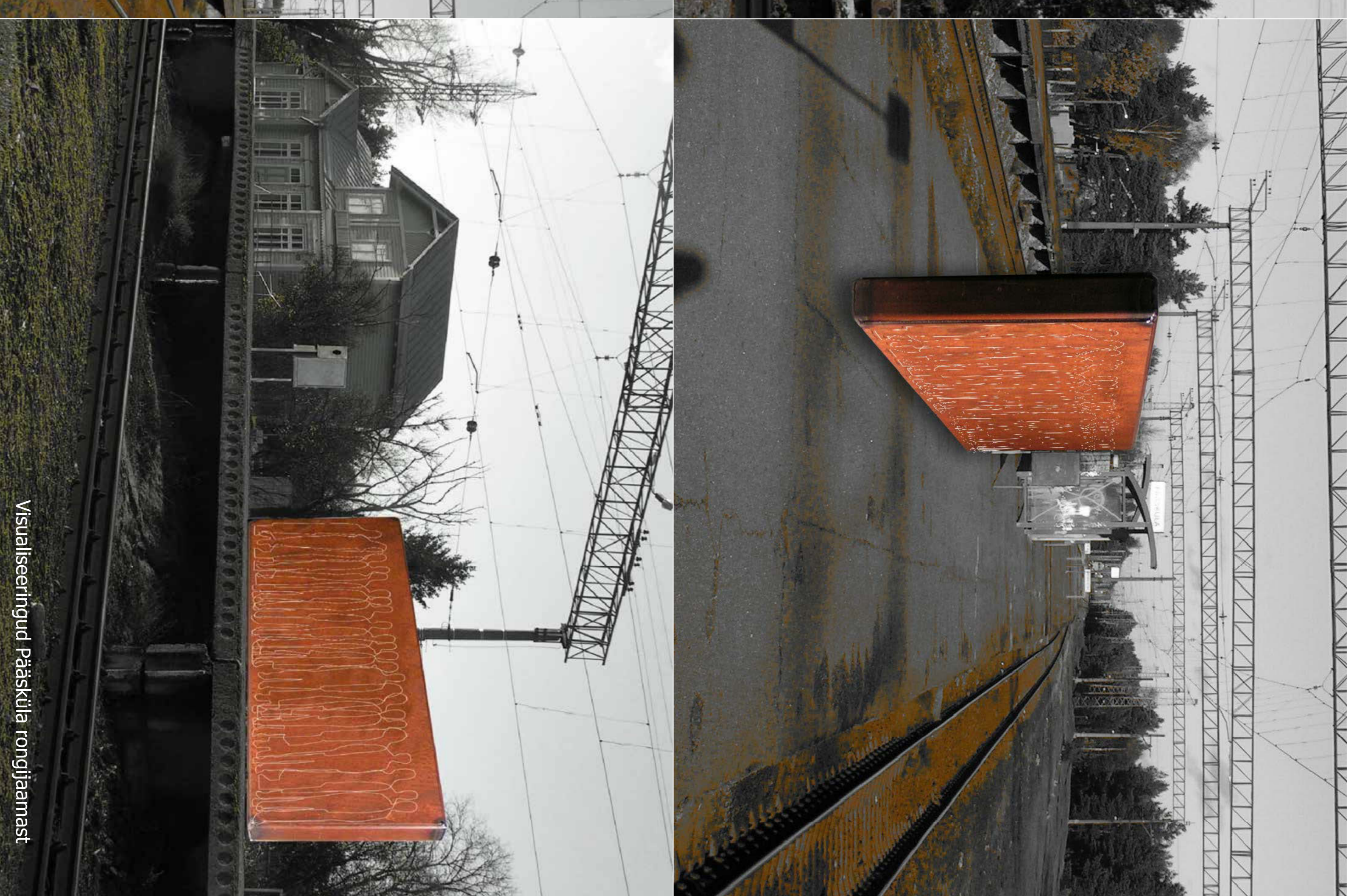
Visuaalseeringud Pääsküla rongijaamast