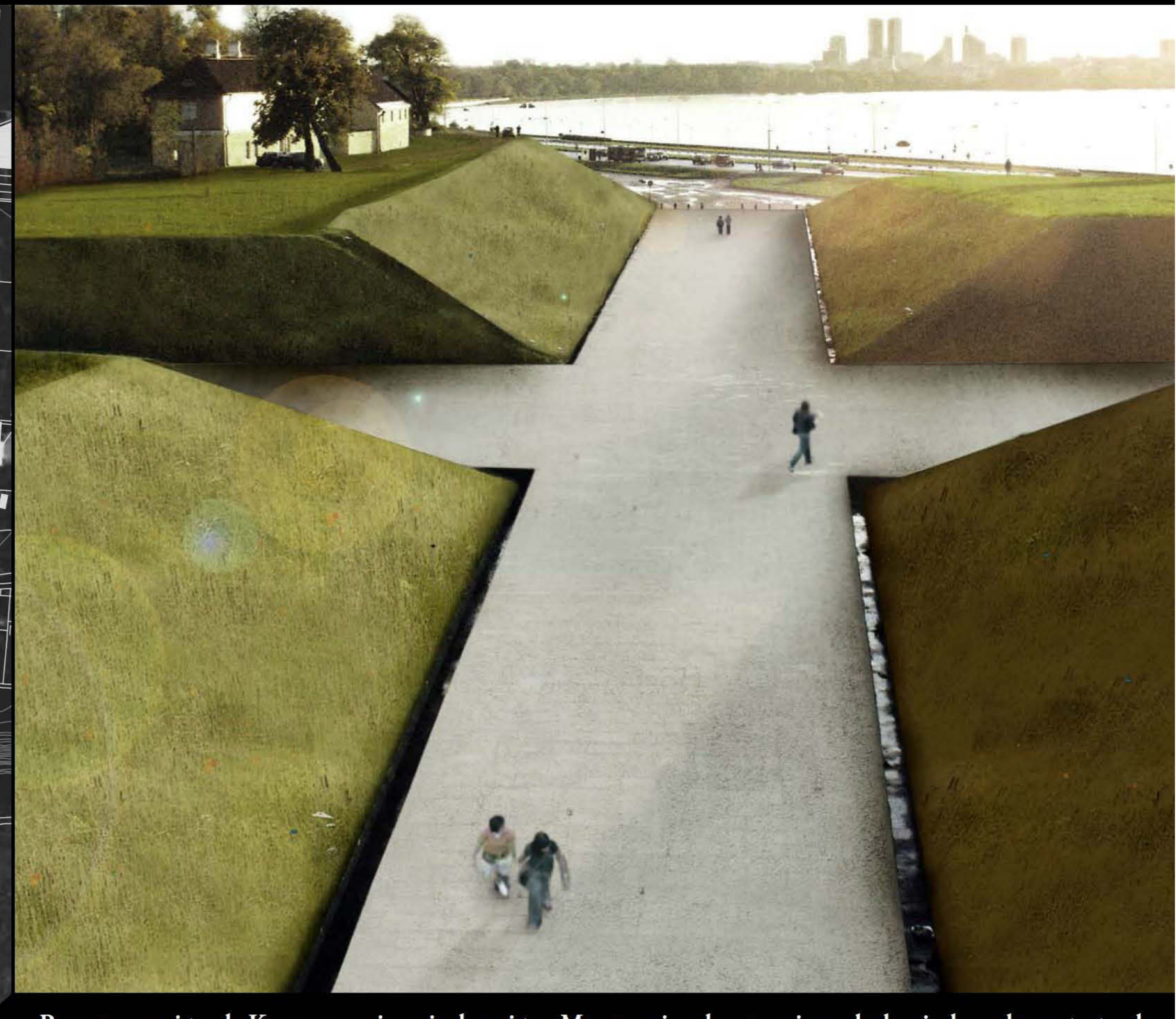
Renoveeritud Kommunismiohvrite Memoriaal on pimedal ajal valgustatud