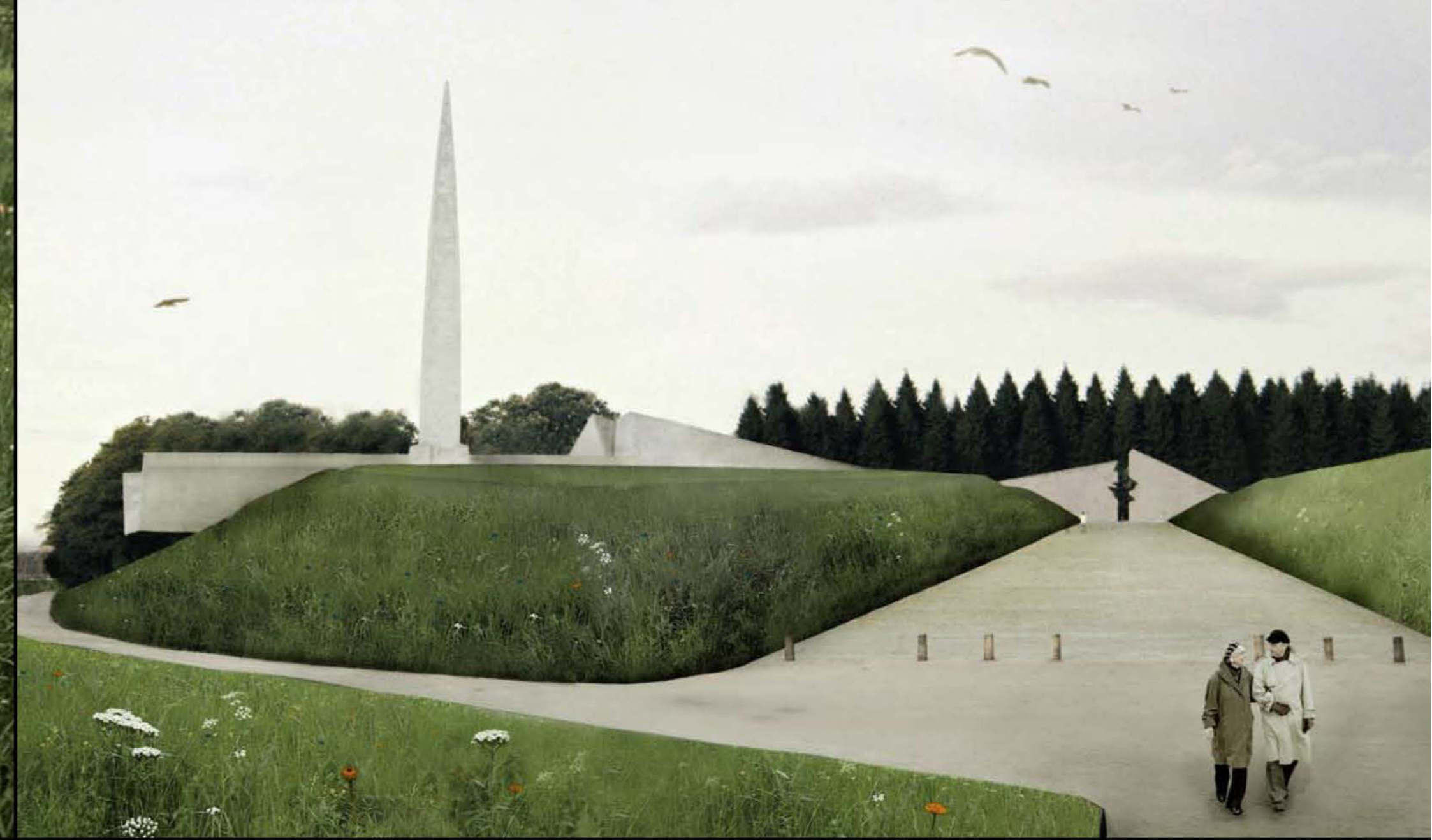
Memoriaali haljasala on kaetud ravimtaimedega