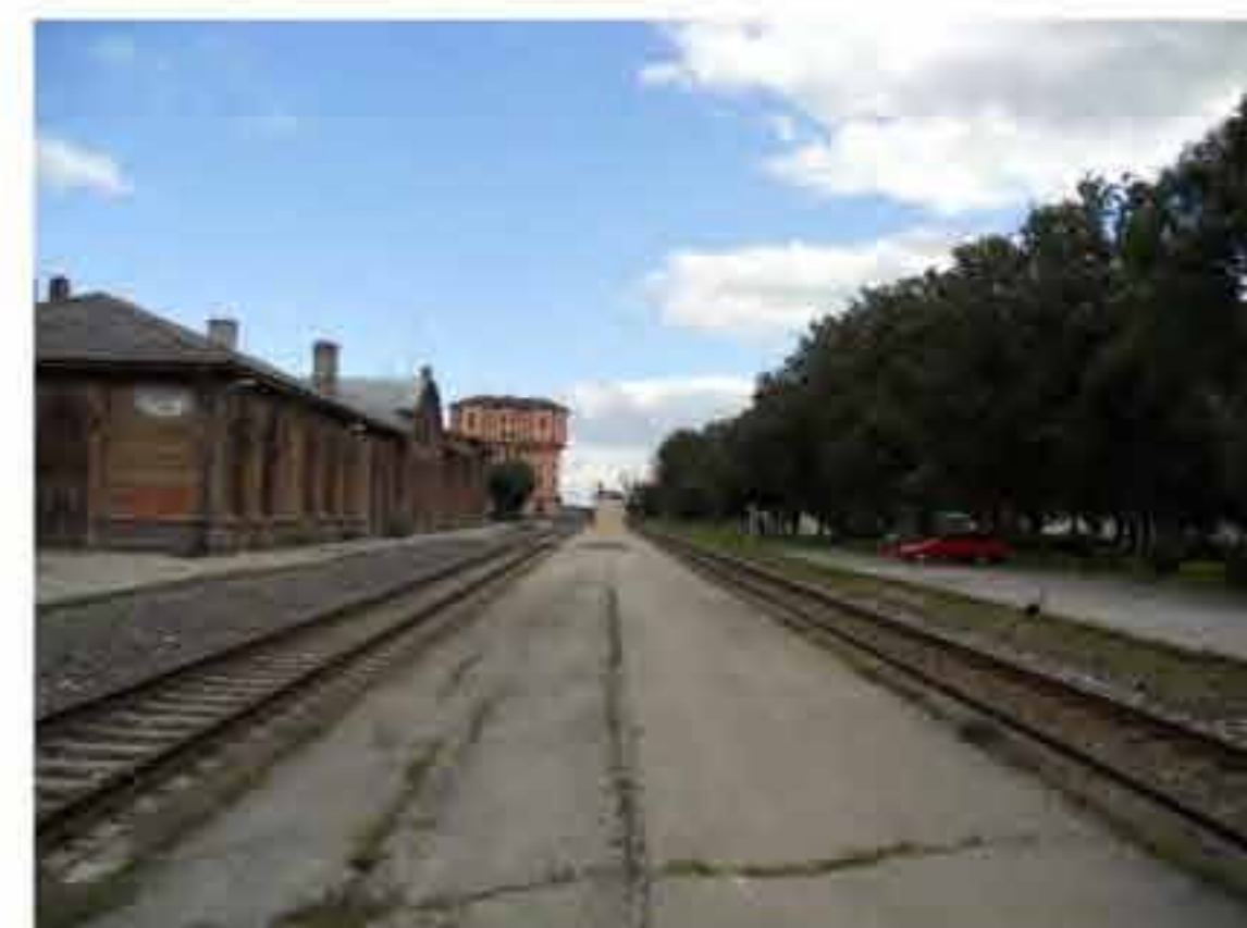
Rongioteperroon raudteejaama hoone ees ja vaade Tartu suunas.