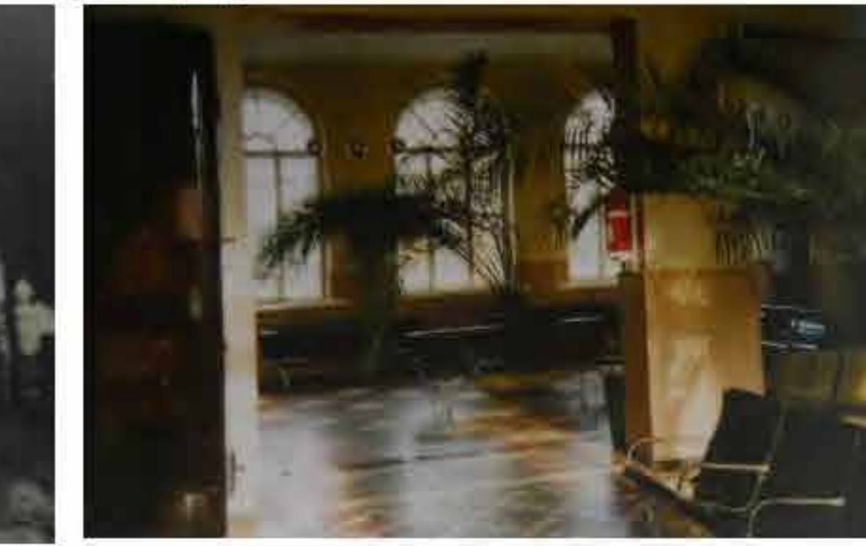
Raudteejaama idapoolne ootesaal 1998.