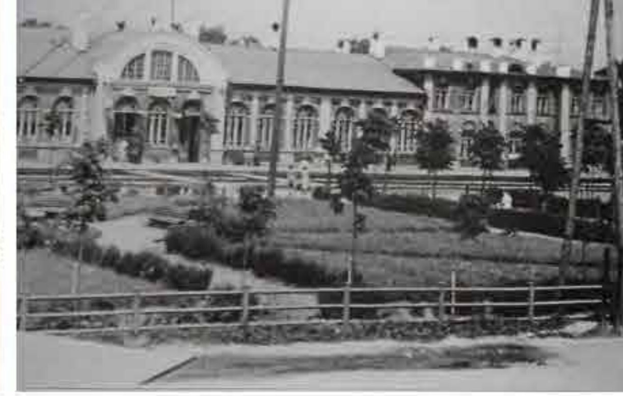
Tapa jaamahoone sõjajärgse parkiga 1955. Sama kujundusplaaniga on park ka praegusel hetkel.