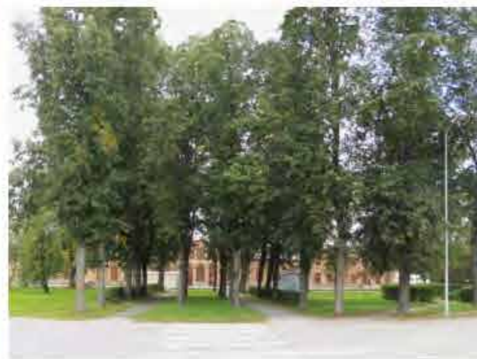
Vaade raudteejaamale kesklinna poolt.