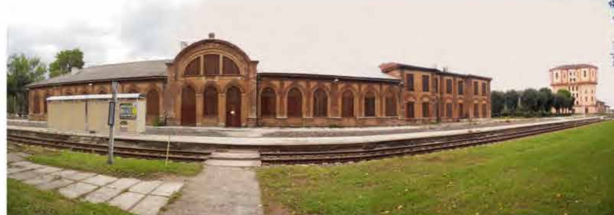
Tapa raudteejaama hoone