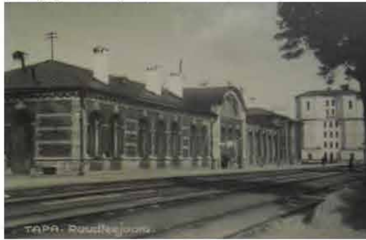
Vaade raudteejaamale lõuna poolt 1930.aastatel.