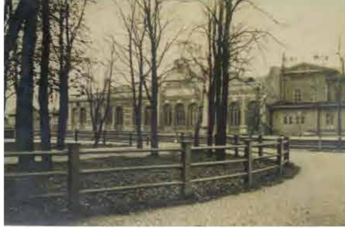
Tapa jaamahoone lõuna poolt 1920.aastate keskpaiku. Ees puidust piirdega jaamaesine park, ümber munakivisillutis.