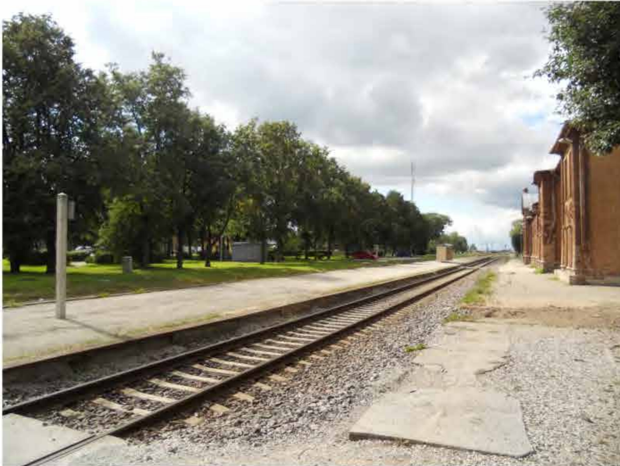
Tapa raudteejaama hoone esine park ja vaade Tallinna suunas.