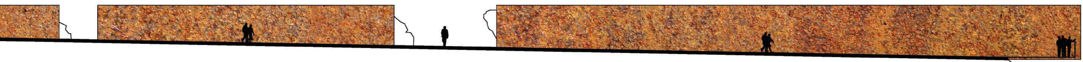
Lõige B - B 1/200