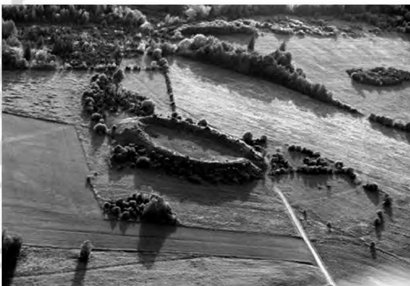
Kahutsi (Põide) Maalinn Saaremaal

tähtsuse tänapäeva ühiskondliku toimimise kontekstis minetanud. Kommunistliku režiimi võimusuhetest on Eestis piisavalt jälgi, kuid sõjaväebaasides on kristalliseerunud kommunismi tähendus Eesti jaoks kõige selgemalt. Baasid olid puhtalt võõrvõimu sümbolid, laialipillutatud üle maa, kuid tänu piiritsoonile tugevalt orienteeritud ranniku suunas. Need baasid on muutunud täielikult kasutuks peale okupatsiooni lõppemist. Nendes sobituvaid sõjaväeliseid struktuure ei eksisteeri taasiseseisvunud Eestis. Baasid omavad täna neutraalset kuvandit - nad ei suhestu siinsete muulastega mingilgi moel rohkemalt kui siinsete eestlastega. Ka tuleviku sõjapidamisviisides pole kohta külma sõja aegsetel struktuuridel. Võib väita, et nendele baasidele on igaveseks määratud sarnane maastikuobjekti saatus nagu Muistset vabadusvõitlust kirjeldavatel maalinnadel. Emotsionaalne laetus ning möödunule viitav memoriaalsus on sellistesse puhastesse diagrammidesse sisse kirjutatud.