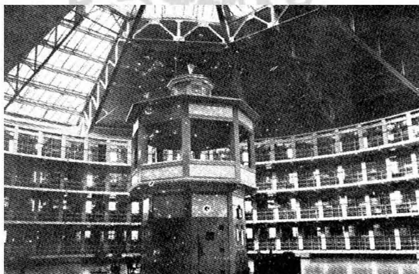
Panoptikumi tüüpi vangla

Selleks, et monument vabaneks valitseva ideoloogia kammitsatest ei tohi ta olla üles ehitatud tänaste võimudiagrammidega sarnaselt. Monument peab iga kord leidma uue vormi, uue skaala ja meediumi, mis kajastab tema ellu kutsumise tegelikku problemaatikat.