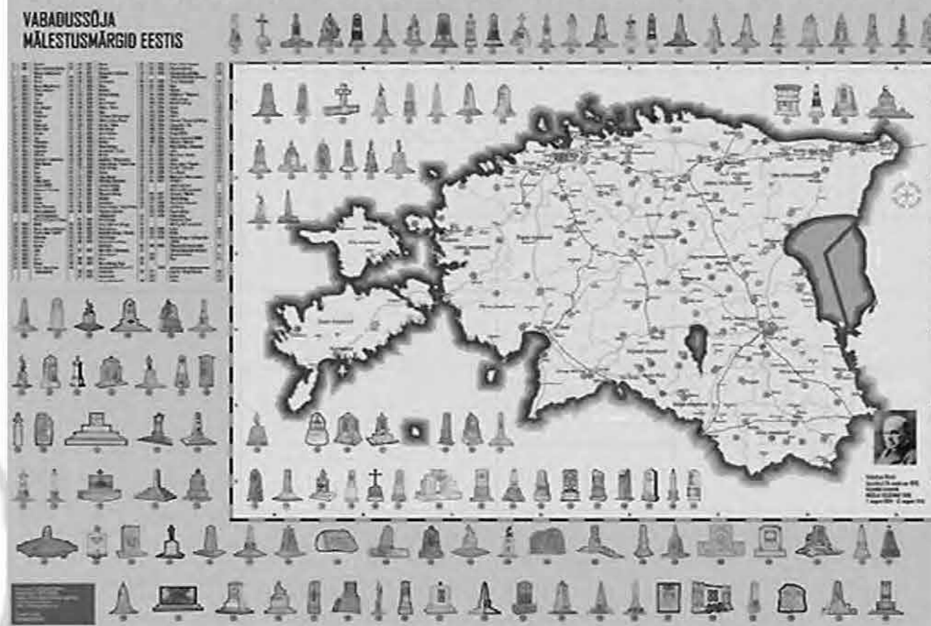
Eesti Vabadussõja mälestusmärgid ja nende paiknemine

tähtsuse tänapäeva ühiskondliku toimimise kontekstis minetanud. Kommunistliku režiimi võimusuhetest on Eestis piisavalt jälgi, kuid sõjaväebaasides on kristalliseerunud kommunismi tähendus Eesti jaoks kõige selgemalt. Baasid olid puhtalt võõrvõimu sümbolid, laialipillutatud üle maa, kuid tänu piiritsoonile tugevalt orienteeritud ranniku suunas. Need baasid on muutunud täielikult kasutuks peale okupatsiooni lõppemist. Nendes sobituvaid sõjaväeliseid struktuure ei eksisteeri taasiseseisvunud Eestis. Baasid omavad täna neutraalset kuvandit - nad ei suhestu siinsete muulastega mingilgi moel rohkemalt kui siinsete eestlastega. Ka tuleviku sõjapidamisviisides pole kohta külma sõja aegsetel struktuuridel. Võib väita, et nendele baasidele on igaveseks määratud sarnane maastikuobjekti saatus nagu Muistset vabadusvõitlust kirjeldavatel maalinnadel. Emotsionaalne laetus ning möödunule viitav memoriaalsus on sellistesse puhastesse diagrammidesse sisse kirjutatud.