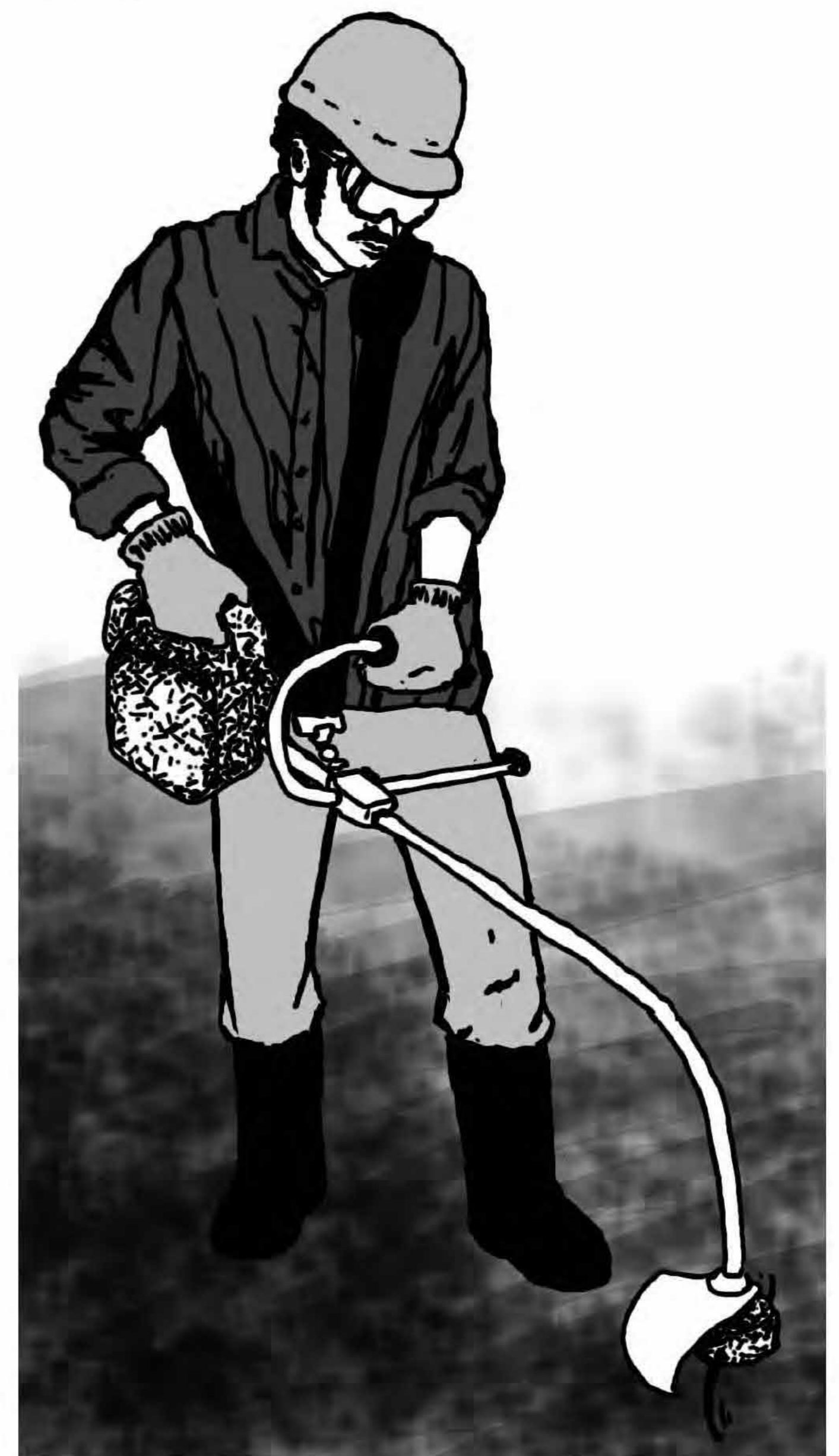
Trimmerimees muru niitmas

MEMORIAAL KUJUTAB ENDAST SÕJAVÄEBAASIDE TERRITOORIUMITE MAASTIKE VÕSAST PUHASTAMIST JA PIDEVAT KORRASHOITU TULEVIKUS. SELLELE LISANDUB OBJEKTIDE TÄHISTAMINE JA AJALOO ESITLEMINE.