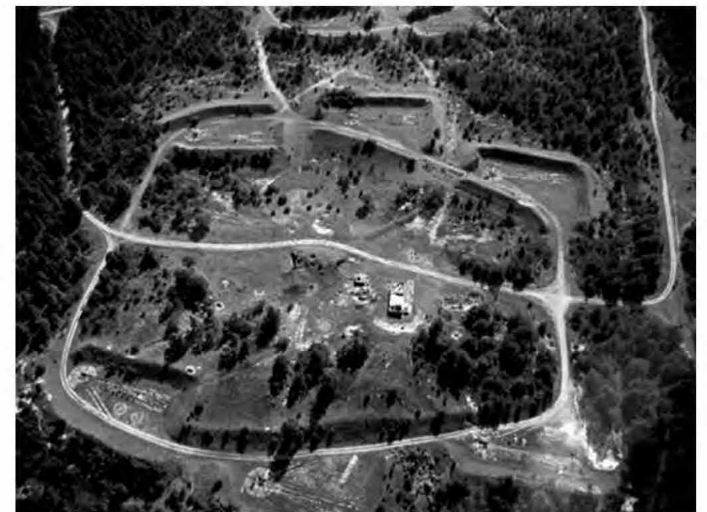
Dejevo (Karujärve) Raketi baas Saaremaal

Eesti ruum erineb valitsevast Lääne maailma ruumilisest konfiguratsioonist oma hõreduse, loodusläheduse ja laialipaisatuse tõttu, ka sinne memoriaal võiks maailmas levinud monumentidest sama kriteeriumi alusel erineda. Kõik siinse piirkonna võimuvahetuste kajastavad ruumilised diagrammid paistavad silma selle hõreda konteksti järgimisega. Sõjaväebaasid on samuti seda ruumilist omapära toetavad objektid. Baaside lisandumisel vaatamisväärsuste hulka muutub kuvand siinset ruumist ühe järjekordse kihi võrra rikkamaks. Hõredat elamist harrastava eestlase jaoks on iga pühapäevane rituaal muruniitmine, juhtugu see siis linnakodus või maal. Niitmine loob metsikust maastikust kultuurmaastiku ja sõjaväebaasist memoriaali. Selle asemel, et eraldada ühekordselt raha ja ehitada järjekordne fetišobjekt tuleks sätestada määrused ja korraldused, et algaks kommunismiohvrite memoriaali kui sõjaväe baaside ruumi korrastamise protsess.