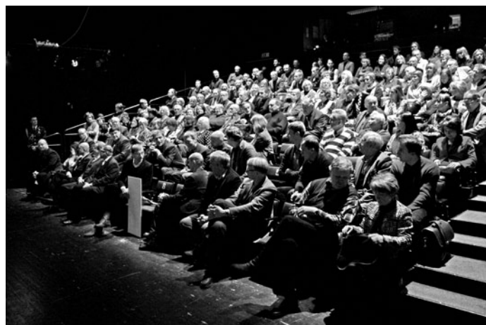
EALi üldkogu koosolek teatris NO99.

P. Pere esitas üldkogule kinnitamiseks koosoleku päevakorra ja üldkogu kinnitas selle. Koosolekule registreerus 145 EALi liiget, neist 24 olid delegeeritud volitusega.