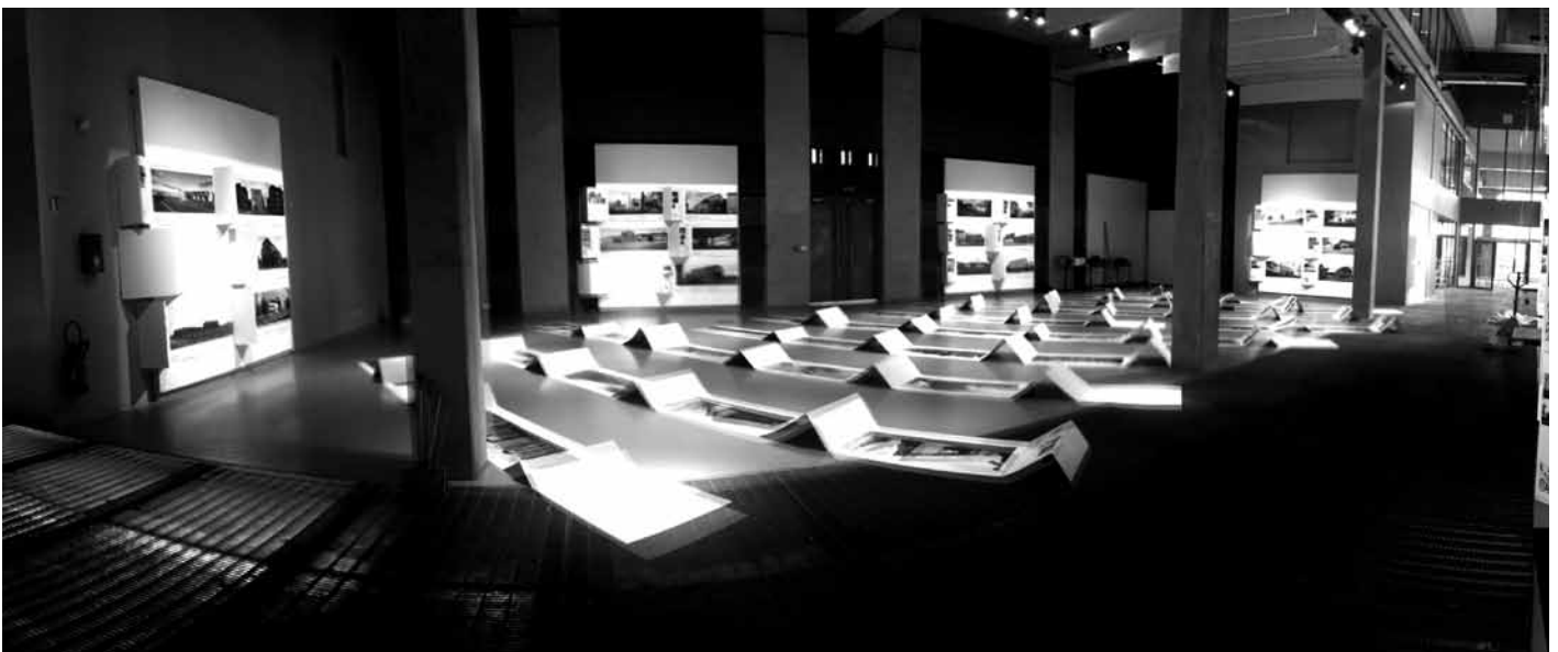
Näitus „BUUM/RUUM: Uus Eesti arhitektuur” Pariisis.