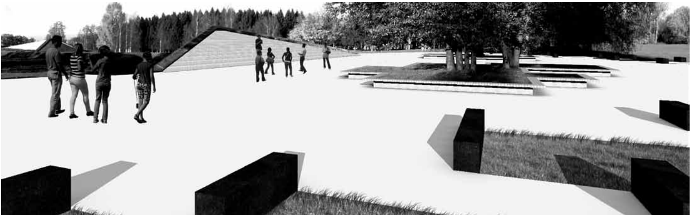
Ideekavand „Mälutulbad”, autor Koit Ojaliiv.