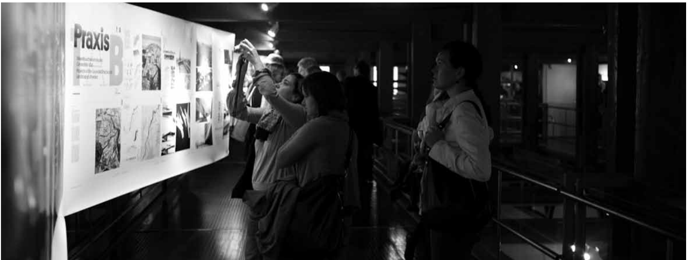
Muljeid Tallinna arhitektuuribiennaalilt, september 2011 (foto: Tarvo Hanno Varres ).